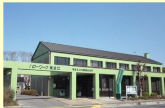
東近江市役所南側 緑色の建物がハローワークです。